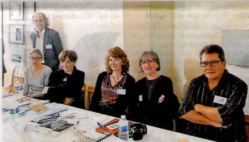
Quelques-uns des auteurs ayant suivi les ateliers d'écriture.

Pour sa deuxième édition, le festival du roman régional, organisé à Grand'Landes par la communauté de communes et le réseau des bibliothèques, a rencontré à nouveau le succès.